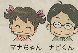
マナちゃん ナビくん

投稿や情報提供、意見、感想をお待ちしています。 〒650-8571、神戸新聞「週刊まなび」編集部、ファクス078・360・5512、電子メールkyouiku@kobe-np.co.jp